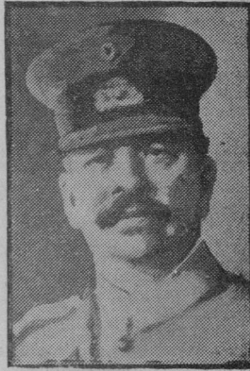
El general Gómez que se encuentra enfermo de gravedad.