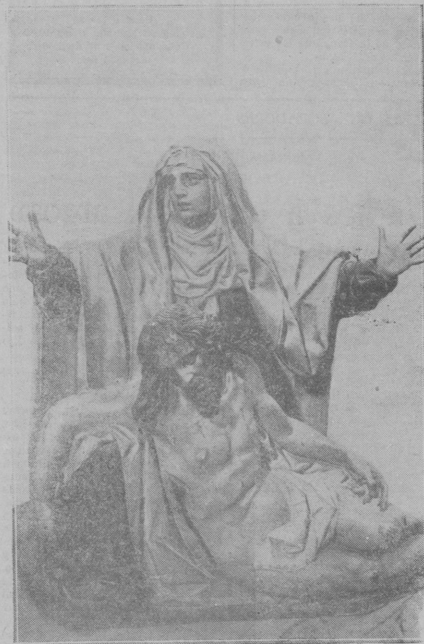
VALLADOLID. — La Quinta Angustia, valiosa escultura de Gregorio Fernández

No podía ser, y no fué. Y el odio se convirtió en amor, y el desprecio, en santa estima, y el horror, en veneración profunda; y el justo se abrazó a ella y la hizo su blasón de gloria y el más preciado entre sus títulos nobiliarios; y el pecador, ante su vista, lejos de estremecerse y retirar su mirada, clavó sus ojos en ella como en su única esperanza; y avanzando con aires de triunfar, como en realidad lo era,