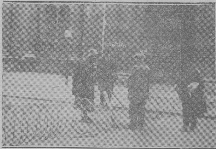
AUSTRIA.—Los soldados poniendo alambrada, para impedir el paso de los revolucionarios

Y ésta es la indicación que nos permitimos hacer, a nuestras autoridades, las cuales a no dudar cooperarán en cuanto puedan para que el turismo recobre el auge que había conseguido en esta isla.