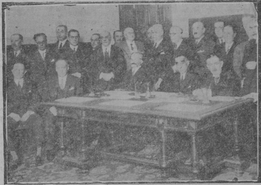
MADRID. — Reunión de los nuevos diputados agrarios en el Congreso, entre ellos se ve al Conde de Romanones diputado por Guadalajara

¿Una condena vulgar? No, señores míos, no. En la Austria actual,