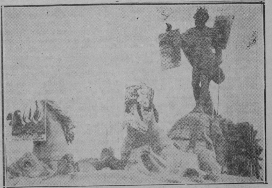
MADRID. — NEPTUNO ELECTORERO. — La estatua del Dios de las aguas en el Prado transformada en vehículo de pasquines partidistas

—Más bien la primitiva, la que no llegó a tener forma. La idea que el señor Azaña esbozó en un célebre mitin de Santander no fué la que tuvo después realidad. No era eso. Y como no era eso, fracasó lo que se hizo. Ahora es posible que se vaya a la federación en desarrollo del primer pensamiento. En cuanto a jefaturas, es prematuro hablar. Se ha lanzado el nombre del señor Azaña por instinto, por deducción, más que por reflejo de realidades que aun no se han producido. Es indudable que para las izquierdas republicanas de España el señor Azaña es un símbolo y es un guía insustituible. Desengañese us-