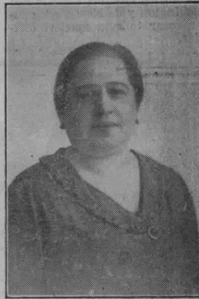
Doña María Mayol Colóm, destacada escritora, de Sóller, que presentada por el partido de Acción Republicana candidata a Diputado a Cortes, será la primera mujer que haya luchado para ostentar la representación de Baleares