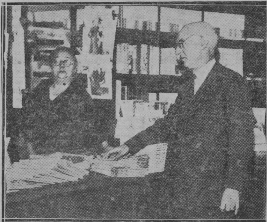
PARIS. — D. Juan March en París, comprando periódicos

Si sirve para que se encarezca el pan, es abominable, y cuantos tengan interés en favorecer al pueblo, en hacer más llevadera la vida a los que solo a fuerza de sacrificios van atendiendo a sus necesidades, deben reclamar del Gobierno medidas complementarias que eviten que la consecuencia del establecimiento de la tasa del trigo sea distinta de la que debe ser.