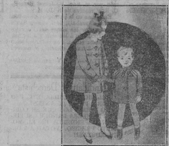
Los lindos abrigitos para nena y nene respectivamente. En lana gruesa verde jade con botones de metal el de la nena. El del nene en tejido de algodón y lana color rubí.

Ta tarde de la última sesión llegó, por fin, y entre pincelada y pincelada fué brotando de labios del pintor la declaración ferviente de sus senti- mientos.