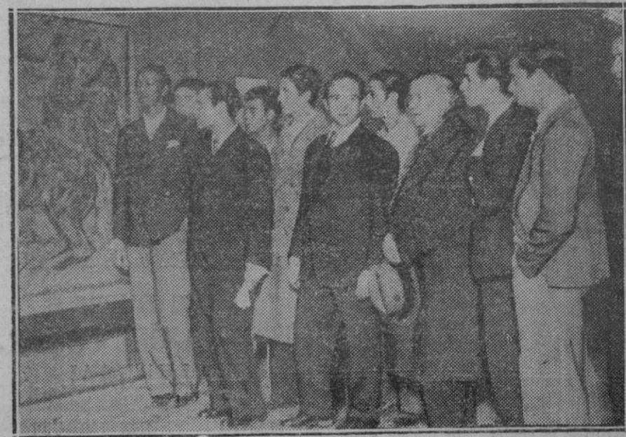
MADRID.—Inauguración de la exposición de Escultores y dibujantes regionales en el Museo de Arte Moderno.

Leyendo el libro de Deffontaines se advierte que el amor del árbol no es ya una literatura, sino una matemática. Cuando el estadista y gran orador argentino Nicolás Avellaneda llama ante su pueblo su eloquente alegato: "No arruicéis ese árbol viejo... Es una vida que ha vivido. Un árbol cae y se construye. Un árbol, no. Es una tradición que se mantiene... delata aquella despreocupación de los valores económicos en que se vivió en el mundo hasta finalizar el siglo pasado, pero ya en aquel tiempo Eliseo Reclus advertía que la vida del bosque tenía una relación material con la vida del hombre y decía al descuido de los gobernantes improvisadores que un árbol menos en el bosque es una gota de agua menos en el río, una ola menos en el torrente devastador, un lago mas en el estuario y una roca menos en la montaña. Dijérase con razón, que a partir de esta advertencia resurje el amor del árbol con un sentido positivista y materialista, con una concepción de negocio, pero conservando siempre, — bien se ve en estos tres libros, — una emoción de idealidad, una fe panteística, un enamoramiento apasionado como aquel de Jerjes, el guerrero persa, que recuerda el profesor Nin Frias. Quédole prendado de la belleza de un árbol y queriendo renunciar el tributo de su amor, mandó adornar sus ramas con pulseras de oro, como si hubiesen sido brazos de mujer... Y queda el mito sin interpretar en el libro de Nin Frias. Porque, en verdad, con aquella declara-