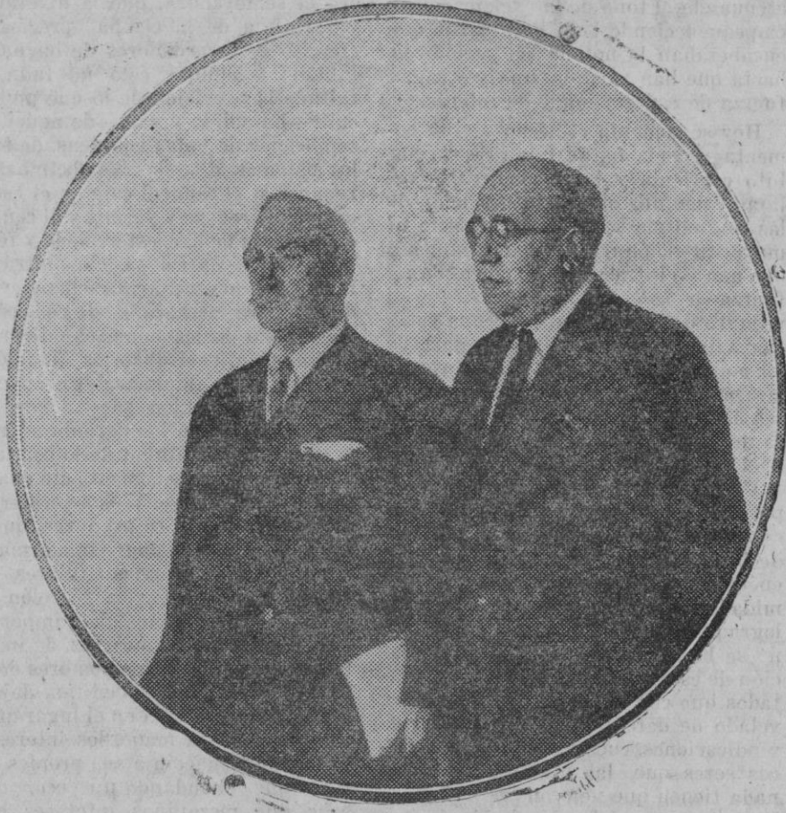
MADRID. — D. Alejandro Lerroux y el Sr. Azaña, después de tomar aquél posesión de la Presidencia del Consejo de Ministros.