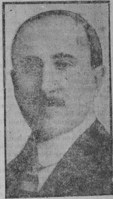
D. Claudio Sánchez Albornoz, Ministro de Estado, que se encuentra en la actualidad en la Argentina

La capacidad de estos depósitos ha sido fijada para el doble consumo probable que tendrá Palma, cuando esté terminada la red de distribución. Así cada uno de ellos, se llenará durante el día para vaciarse en el siguiente, permaneciendo el agua durante 24 horas con la solución de hipoclorito que ha de esterilizarla. Además, efectuado el cambio de depósito a hora conveniente, puede pro