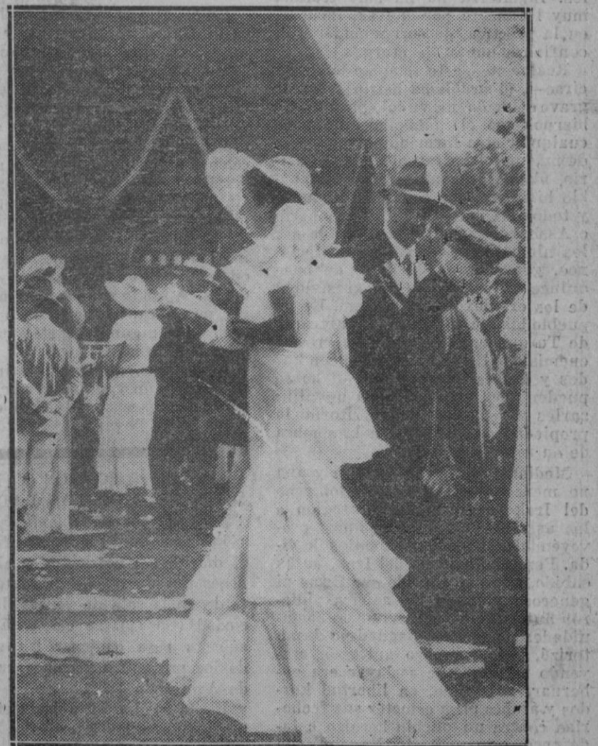
Uno de los nuevos modelos aparecidos en la playa de Deauville el día de la adjudicación del Gran Premio.

Pero esta actividad industrial decayó en los espíritus hispano-americanos debido a la calidad inferior de las mercancías abastecidas, las largas demoras de los envíos y entregas, pero sobre todo las condiciones poco favorables del crédito, así que después de la guerra, la renovación de la actividad industrial permitió a las naciones exportadoras europeas recuperar en la América latina gran parte del territorio perdido, volviendo a inclinar las corrientes económicas hacia Europa, debilitada y empobrecida, que perdió mucho de su poder de expansión, mientras creció de