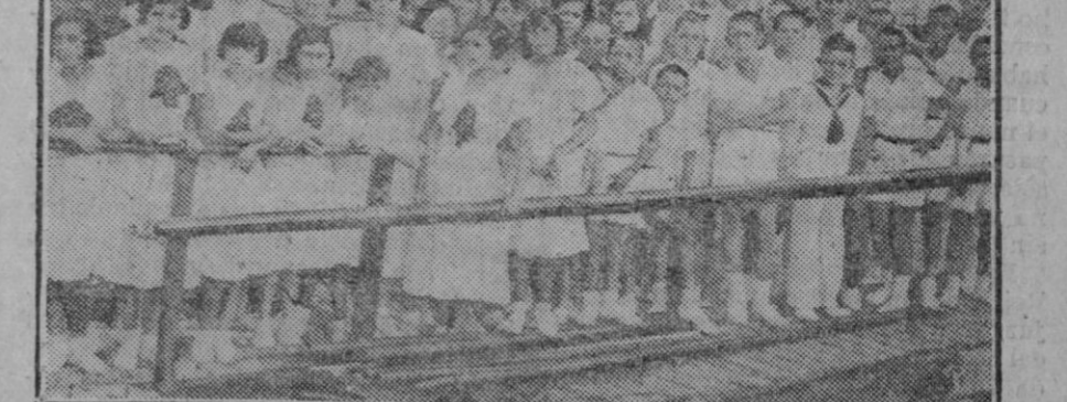
Las niñas y los niños de la colonia escolar del Hogar Escuela de Huérfanos de Correos de Madrid que invitados por el Club Náutico dieron un paseo en canoas automóviles por el puerto de Barcelona.

Los nacidos bajo el signo de Aries —20 de Marzo a 20 de Abril— con frecuencia se agotan por falta de sueño. Tienen gran energía y necesitan mucho descanso o se desgastarán prematuramente. Los nacidos bajo el signo de Tauro—20 de Abril a 20 de Mayo—son propensos a perturbaciones cerebrales y apoplejía. Debe abstenerse de una vida demasiado intensa y no cometer excesos en la bebida. Físicamente están dotados de una