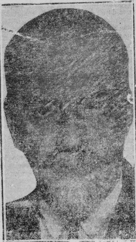
El gran Duque Alejandro de Rusia principal personaje de la desaparecida corte Imperial, que acaba de fallecer.

Hemos de suponer lógicamente que en breve se dará cumplida y satisfactoria contestación a la oferta hecha al Ayuntamiento de Palma y a la Diputación de Baleares por el Consejo de Administración del Patrimonio de la República, oferta generosa que no solo ha de ser aceptada sino que debe ser agradecida.