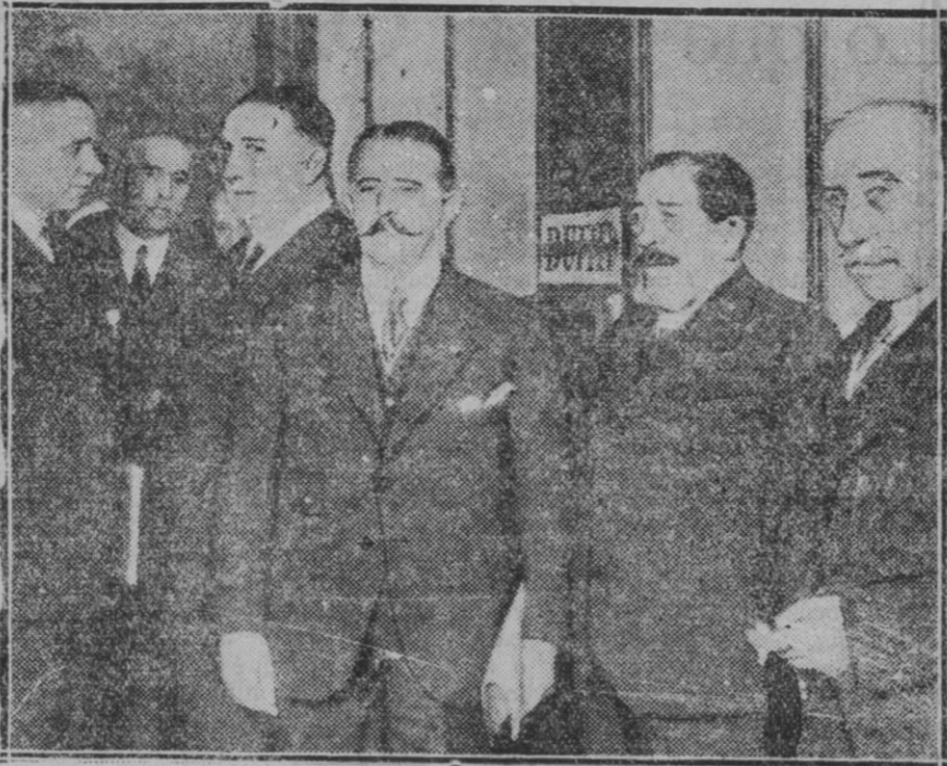
MADRID.—Los generales Saro, Berenguer (D. Federico), Cavañanti Mayandía y Muñoz Cobos, en los pasillos del Senado, duran uno de los descansos en la vista de la causa por responsabilidad.