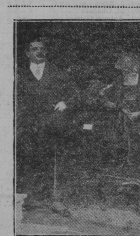
El señor Herriot, presidente del Consejo de ministros francés, ha presidido las fiestas conmemorativas de la unión de Bretaña a Francia. En la fotografía se le ve acompañado de la Reina de los bretones en París, ataviada como la duquesa Ana; en segundo término, las damas de honor.