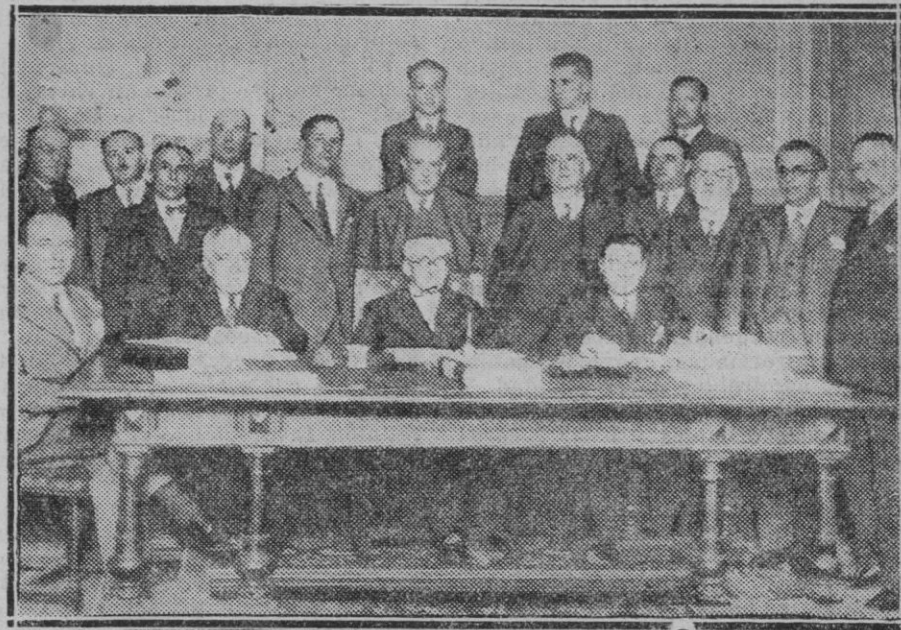
MADRID. — La reunión de la Comisión de Responsabilidades para señalar la fecha de la vista de la causa instruida con motivo del golpe de Estado del 13 de Septiembre y examinar los escritos presentados por las defensas

—¡Cordones para las "sabatás"!... PEDRO BARRAGAN (Reproducción prohibida.)