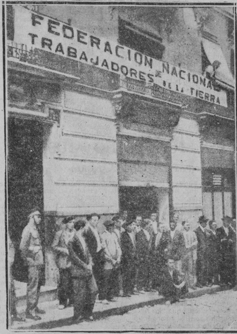
Madrid.—Con gran entusiasmo y concurrencia de muchas provincias se está celebrando el Congreso de Trabajadores de la tierra, con reuniones en los Teatros Pardiña y Metropolitano.

Seguros estamos que si con atención se ponderan estos peligros, veremos realizado el proyecto de organizar la inspección de los víveres en la forma que el interés del vecindario reclama.