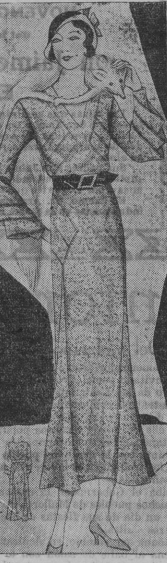
Vestido en lana roja, chiné de seda blanc onegro. Cortes formando "V". Cinturón de ante negro