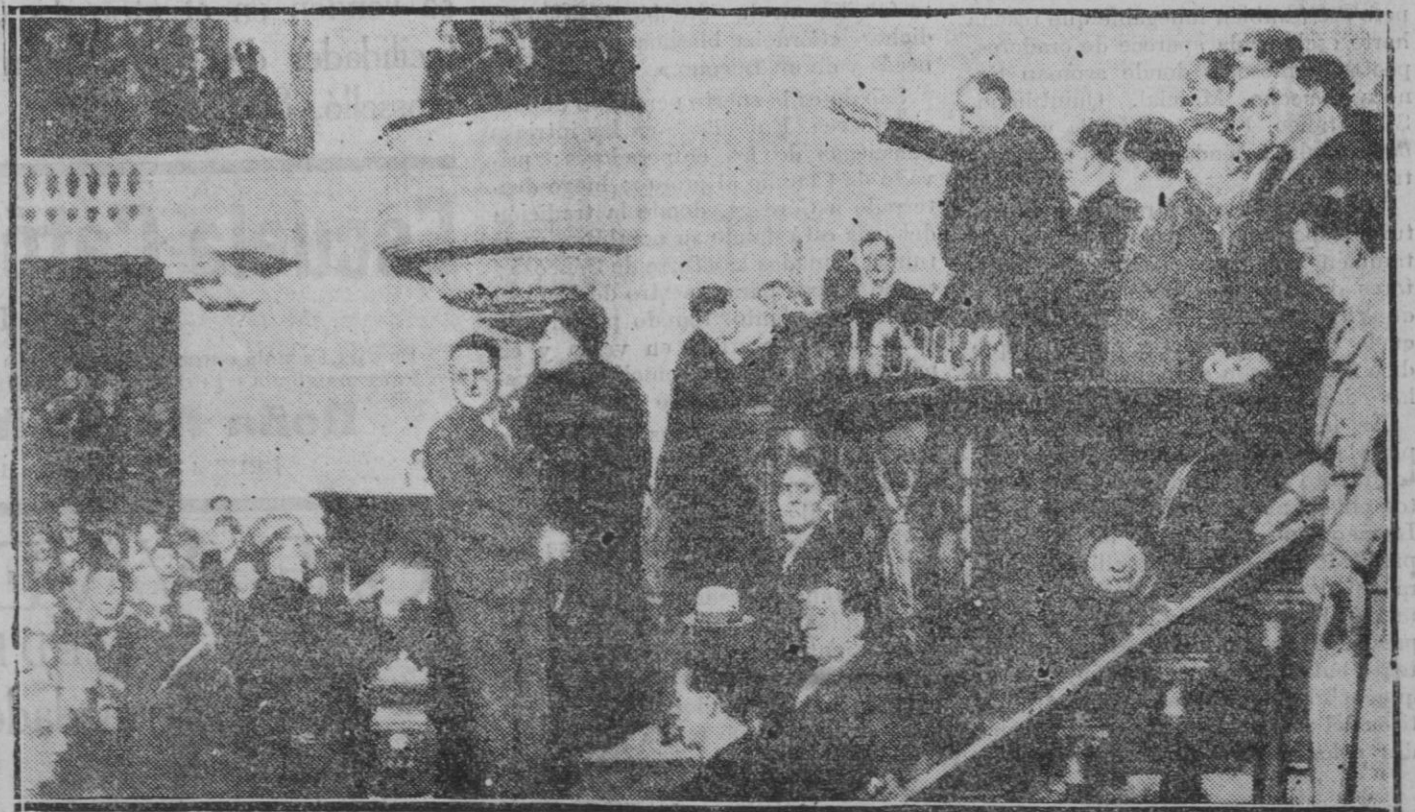
El nuevo Presidente de la República de Méjico, don Abelardo Rodríguez en el momento de la promesa constitucional ante los miembros del parlamento.

Londres.—El calor vuelve a sumir a la capital en los rigores de una temperatura insostenible. Falta el aire y a pesar de ser la circulación escasa, las pocas personas que se han visto en la necesidad de salir a la calle han sufrido los efectos de esta temperatura de horno. Ayer murieron 24 personas por los efectos del calor. En otras poblaciones los incendios han sido numerosos, ardiendo granjas de aves y pereciendo miles de pollos.