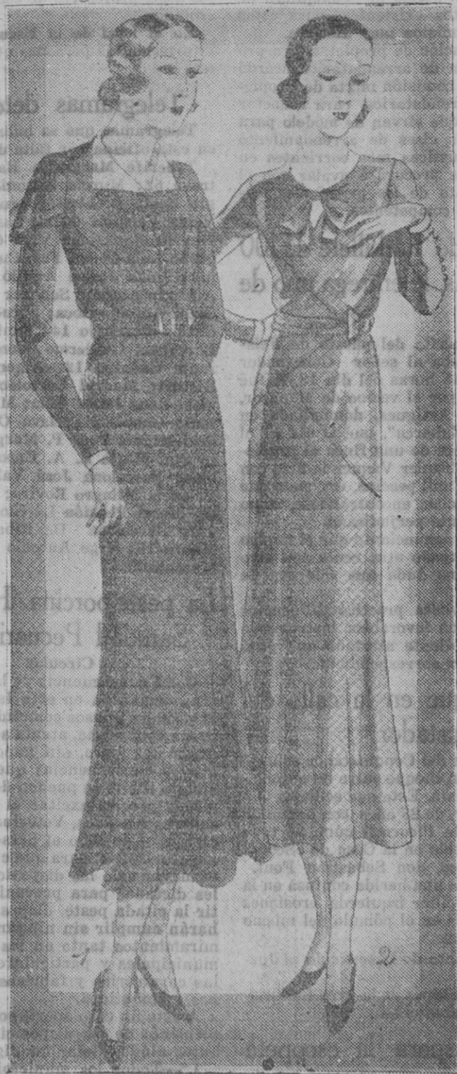
Vestido en crepón romano de lana. Cortes punteados a 1 cm. del borde. Botones de tejido. Cuello en crepón de china blanco