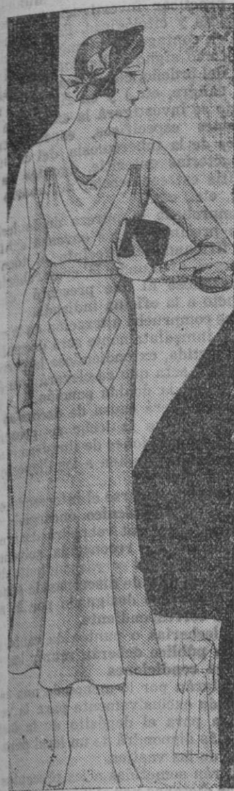
Vestido en georgette de lana roja. Canses. Falda y puños con cortes formando grecas