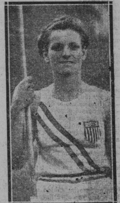
LOS ANGELES.—Babe Didrikson, la figura más destacada de cuantos atletas han asistido a la Olimpiada, alcanzando los mayores triunfos. Esta muchacha norteamericana, es la atleta mejor del mundo

Sin embargo de este equino atuendo, el príncipe carecía de cabalgadura. Como, careciendo de condecoraciones, lucía perennemente una rosita de cualquier orden creada por su fantasía.