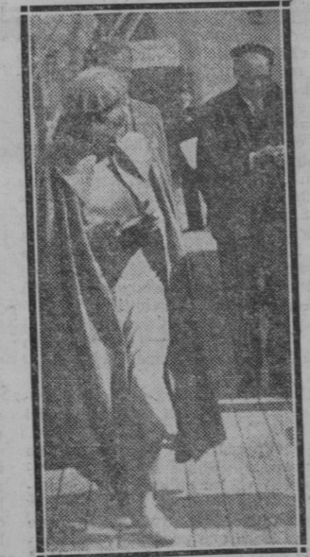
La célebre e insigne actriz cinematográfica Greta Garbo, a su llegada a Suecia