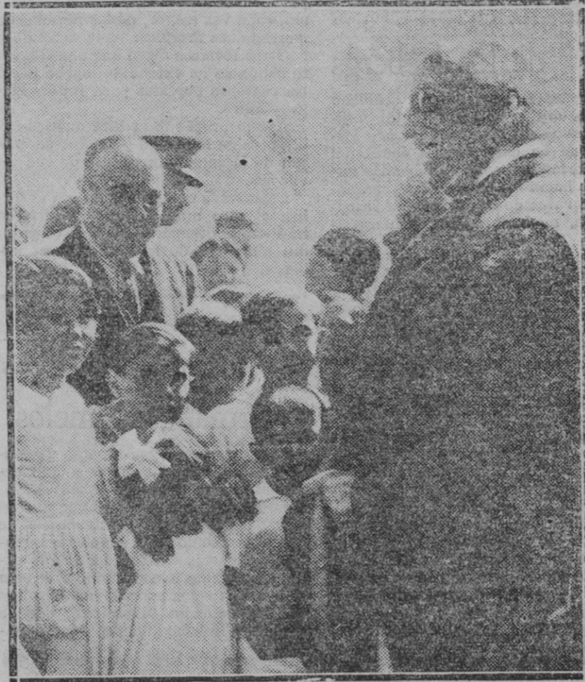
SANTANDER.—El Presidente de la República es invitado por los niños de las colonias escolares madrileñas, despidiendo el Jefe de Estado cariñosamente con los chiquillos