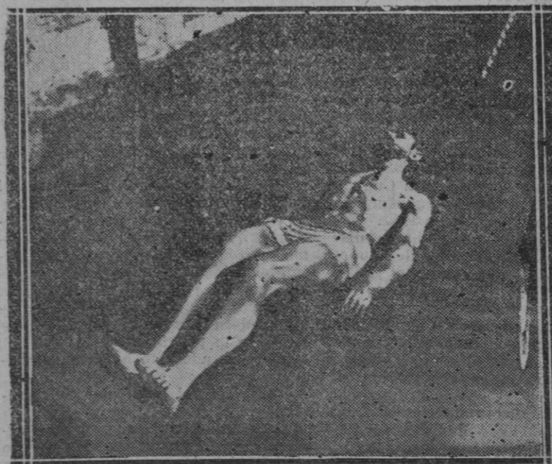
En la iglesia del pueblo de Gueñes (Vizcaya), se ha cometido un robo sacrílego.—Los ladrones se llevaron dos cálices, destrozaron el cepillo de las limosnas y sacaron de su urna el Cristo yacente (en la fotografía puede verse la forma en que lo dejaron abandonado), llevándose las alhajas.

Hay otra visión española de esta modificación que se intente en nuestra geografía. Francia pretende estrechar el estrecho de Gibraltar, como paso del Atlántico al Mediterráneo, pero con mayor ahínco aun desea esquivar el Estrecho como paso de España a África. Ya es indicio suficiente el hecho de que el Congreso de Tolosa, en que ha resucitado el ensueño centenario de hacer un paso propio del Atlántico al Me-