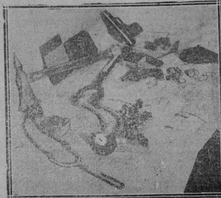
MADRID.—Las pistolas, tiradores y municiones capturados por la policía en los pasados sucesos revolucionarios