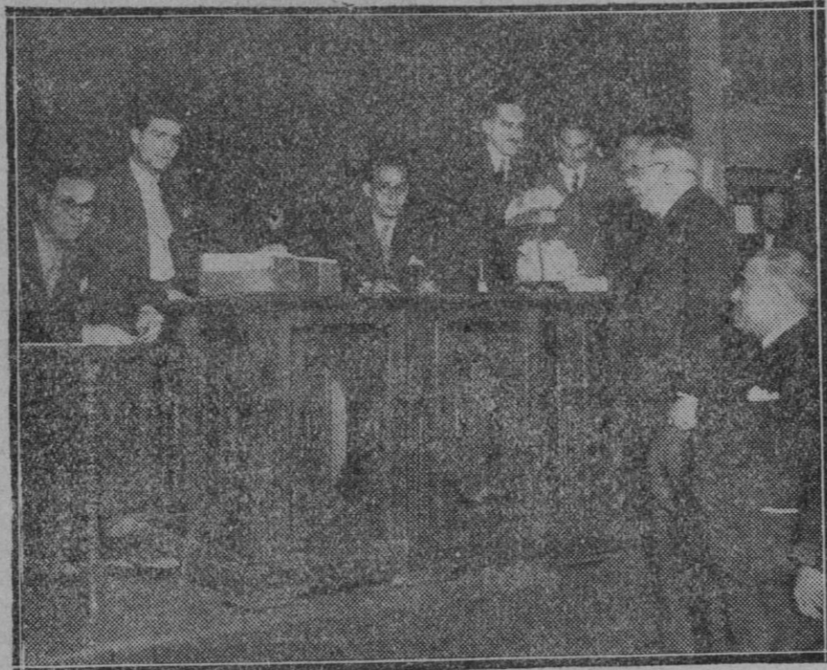
MADRID.—Votación para presidente de Junta del Ateneo.—El Sr. Azaña que hasta ahora ocupó dicho cargo al emitir su voto

Al celebrar que el proyecto de canalización entre en vías de pronta ejecución, hemos de recabar del Ayuntamiento que no se echen en olvido los otros proyectos que juntamente con el que va a ser realizado, deben constituir el programa inmediato de nuestra Corporación.