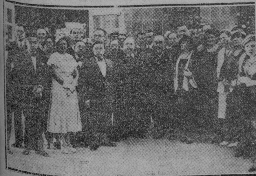
EN LA ROSALEDA.—El Ayuntamiento ofreció un té a los miembros del Congreso Nacional de Abogados.

No un órgano reaccionario, sino afecto a la política que se sigue en aquella Oficina, "L'Home Libre", escribía hace pocos días: "Hay trabada una competencia ávida para alcanzar la sucesión del recién fallecido Albert Thomas. Sumas enormes se consagran al sueldo y dietas del Director de la Oficina Internacional del Trabajo. Muchos creemos que en lugar de nombrar una persona solamente en el puesto de Thomas, se podría repartir el sustancioso queso entre muchos conflictos mas o menos hambrientos." Y como comentarios agregamos: "Hay un contraste doloroso entre la situación mundial, la crisis que angustia a todos los países, el 'chomaje' y la miseria que se extiende y de otra parte, los sueldos prodigiosos que se han distribuido estos logreros de la