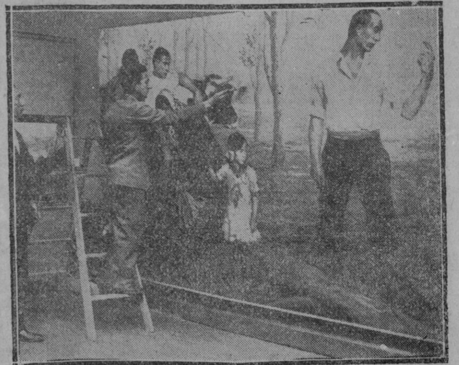
MADRID—Barnizaje de cuadros, para la Exposición Nacional de Bellas Artes, que se inaugurará hoy sábado en el Palacio de Exposición del Retiro.