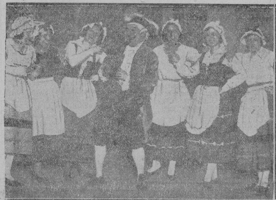
MADRID.—Calderón.—Una escena de la obra "El amor manda en Palacio, que se estrenó anoche con gran éxito.

rarelo a un arroyo cantarón. Crúceme con varios campesinos que disputaban airados con un buhonero, quien traía sobre los lomos de su cainsina acémila la más variada bisutería.