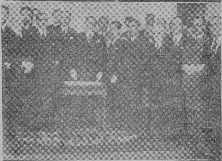
La Acción Española.—D. Ramiro de Maeztu, rodeado de distinguidas personalidades, después de la conferencia que pronunció anoche en dicho Centro.

Mirando al éxito de la misma creemos que sería oportuno que la petición de restablecimiento de la expresada Escuela, se hiciera en la forma que hemos expuesto.