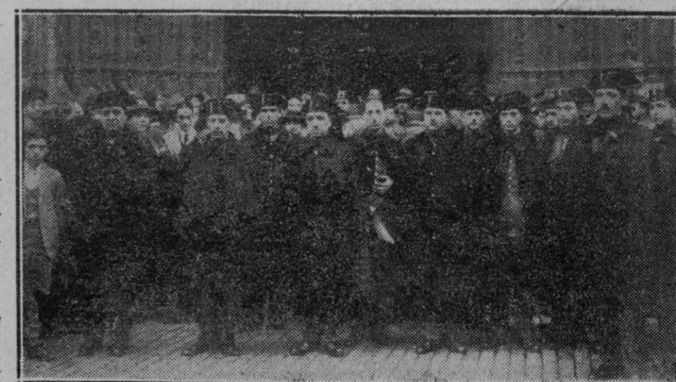
BILBAO.—Funerales por las víctimas de Castilblanco, con asistencia de las autoridades civiles y militares

Treinta y un años de sacrificios de contiendas enojosas, de gastos innumerables, de vidas perdidas, de pobres soldaditos que no fueron allí por su voluntad, enterrados en el arenal ineluctable. Río de Oro como casi toda la costa occidental de Africa, era una pro piedad española, por razón y derecho