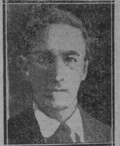
Lord Litton, delegado de la Gran Bretaña en la Comisión de encuesta en Manchuria designada por el Consejo de la Sociedad de las Naciones

Francia, en este caso ha sabido hallar una solución justa, equitativa y que al parecer da los mejores resultados. En su colonia de Madagascar, isla de extensión territorial mucho mayor que Francia, y una de las llamadas a figurar entre las más ricas tierras del mundo entero, ha establecido un servicio civil, es decir, que se alista en las cuadrillas de trabajadores solamente a los negros que se hallarian, en otra