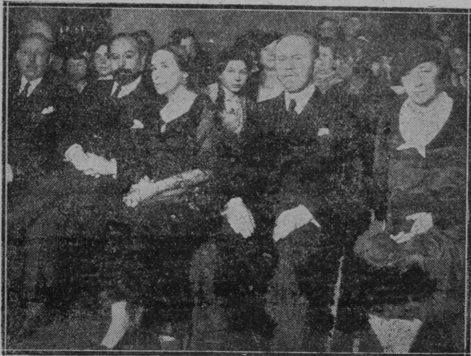
MADRID.—En el Lyceum Club Femenino se ha verificado una brillante fiesta de carácter intelectual, a la que asistieron el ministro de Checoslovaquia y el de Instrucción Pública, Sr. De los Rios.