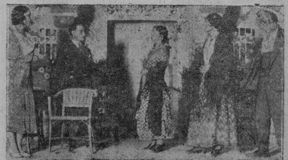
MADRID.—Una escena de la comedia "Los caballeros", estrenada anoche con gran éxito en el teatro de la Zarzuela.