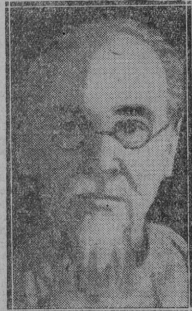
Lim-Sen, que ha sustituido a Chang-Kai-Shek, en la Presidencia de la República china

Hasta 1914 duró la tendencia a la violencia, como único método de lucha social. En esta fecha, el sindicalismo francés suspende sus frentes y condiciona sus hombres a las necesidades de la guerra. Y cuando en 1918 había adquirido Francia la victoria, la tendencia de los sindicatos se había debilitado y emprendía otros rumbos, los cuales se pusieron de manifiesto en la huelga ferroviaria francesa, la minera inglesa y la metalúrgica italiana; est es la más potente que estuvo a punto de llevar a la nación a un régimen comunista.