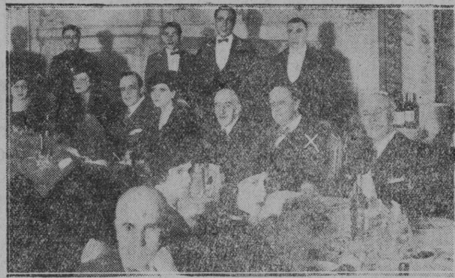
MADRID.—Banquete a D. Emilio Thuillier, con asistencia de D. Jacinto Benavente y D. Alejandro Lerroux. Aspecto de la mesa presidencial, en dicho banquete.