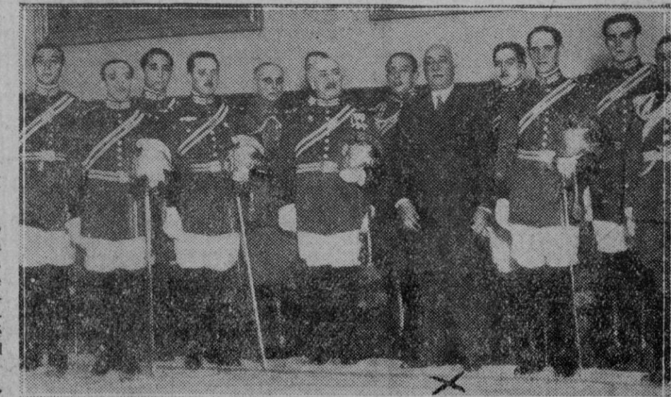
MADRID.—Grupo de la oficialidad de la Escolta del Presidente de la República, que fué a cumplimentar.

¿Saldrá V. de compras? Visite pues la Casa Matons