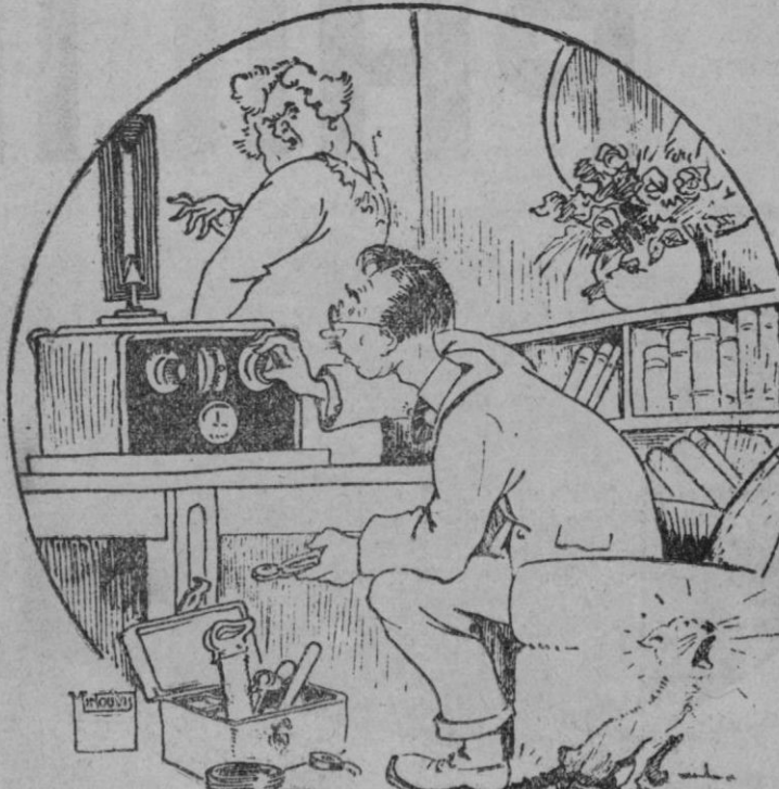
La señora. (Oyendo los ladridos del perro).—Estarás contento de haber conseguido arreglarlo.

Esperábamos con ansia que la República evitara que España fuera un país donde en cualquier parte se encuentran todavía esos animalillos que demuestran que es un país sucio, como se ven en muchas posadas y casas particulares; que España fuera una nación que pasara por la vergüenza de ser casi la única de Europa donde existen todavía frecuentes casos de viruela, enfermedad tan fácilmente evitable, donde la tifoidea hace estragos en