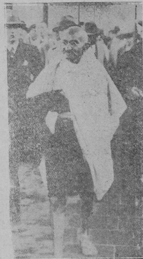
Gandhi a su llegada a Londres para asistir a la conferencia de la Tabla Redonda en representación de los nacionalistas indios.

(De la "Agencia Internacional Arco"). (Prohibida la reproducción).