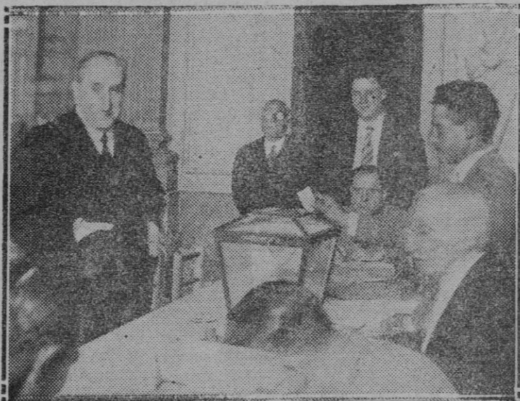
MADRID.—El expresidente del Consejo de Ministros don Joaquín Sánchez de Toca en el momento de depositar su voto.

EL AMOR El amor ha sido siempre igual en todos los tiempos, a través de todas las edades. Las formas, los procedimientos quizá se hayan alterado, siguiendo el ritmo lógico y renovador de la vida. Pero su esencia es única, inalterable. ¿Cada uno a su manera? Desde luego. Y eso es lo que menos interesa, ya que cada uno cree hacer de él de manera perfecta, o sea de acuerdo con la noción que tiene de lo que es perfección. Llegado a eso, voy a complacerla reproduciendo algunas reflexiones del autor de su preferencia; observaciones dignas algunas de atención y otras desprovistas de interés. Ahí van: