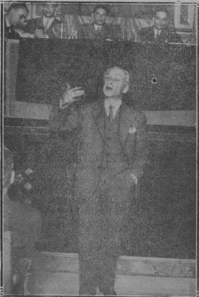
El ministro de Fomento al pronunciar un discurso en la accidentada reunión que celebró el partido radical-socialista

Por el atraso urbano que Palma sufre; por la posibilidad que existe de realizar tales obras, y por exigir las actuales circunstancias la mayor movilización posible del capital, creemos que es un deber de la nueva Corporación disponerse a realizar una gestión activísima e intensa.