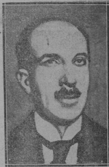
EXTRANJERO—El ex-ministro polaco del Trabajo Francisco Soikal, que ha sido elegido presidente de la decimoquinta Conferencia Internacional del Trabajo, que se celebra en Ginebra actualmente

cultivos, aunque sí el valor desnudo de la tierra sobre que se efectúan... Ese impuesto impulsa inmediatamente la edificación y el cultivo, pone en circulación los solares y las fincas, parcela los latifundios, mejora los arriendos, inicia una transformación de la estructura social.