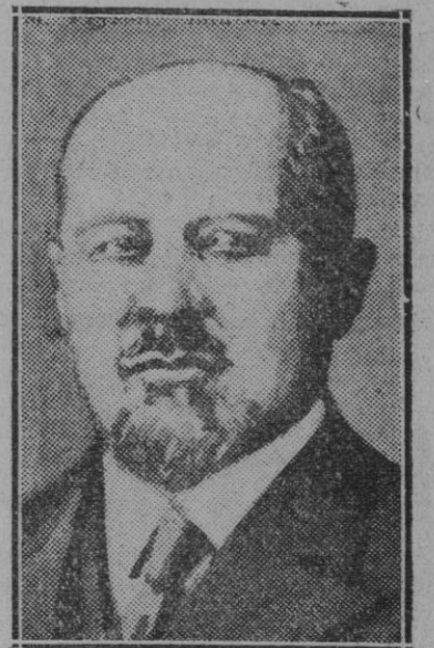
ETRANJERO.—Piłtrow, ministro de Comercio e Industrial en el Gabinete polaco dimisionario que presidia Slawek, que se ha hecho cargo de la Jefatura del nuevo Gobierno