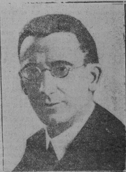
Don Luis de Zulueta, embajador en el Vaticano

El Banco de España, podrá ayudar a los Bancos en este terreno, mas los tiempos que vengan, pondrán de relieve la necesidad de contener la inflación ahora existente, en la cantidad de billetes emitidos, y que prueba abiertamente que la cifra actual de circulación, no refleja la de nuestro movimiento circulatorio. Tenemos también una crisis de escasez en el mercado monetario no obstante esas