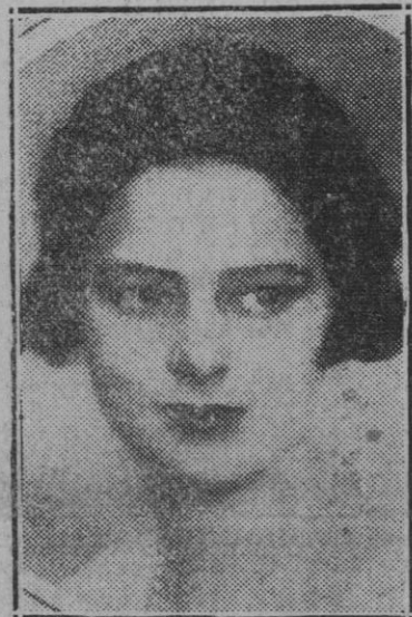
La princesa Iliana de Rumania.

Porque el Ministro de Hacienda, es eso, un autodidacto. Un producto del siglo de juventud tormentosa, crecimiento y haciéndose hombre a tropiezos con la miseria; conoció lo difícil que es en España, donde al "hombre", se le da tan poco valor, ampararse sobre la ineptitud. Más lo consiguió. De obrero modesto, llegó a periodista. Taquígrafo, redactor, fué formándose