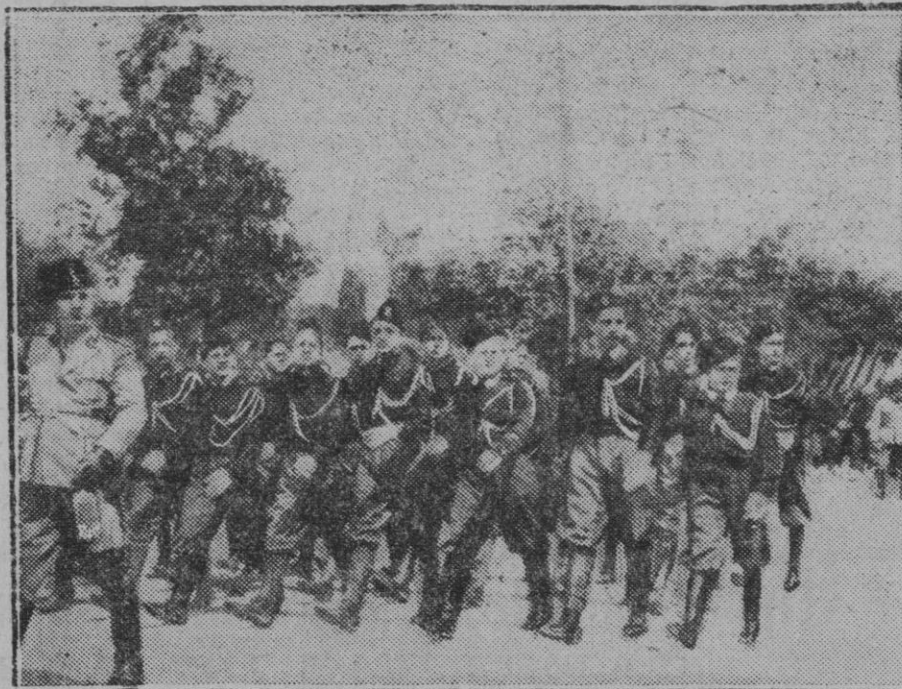
ITALIA.—La nueva leva de jóvenes fascistas desfilando por las calles de Roma, al frente de los cuales figuran los hijos de Mussolini.

La conveniencia general es, debe ser, el dictado que guíe la actuación de los que asumen autoridad.