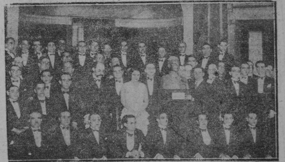
MADRID.—La banda del Real Cuerpo de Alabarderos, que hoy se llama republicana, y que dió ayer tarde un concierto en el Ateneo

Número de diputados de que estarán compuestas las Cortes Constituyentes, según el censo de población vigente formado en 1920 y aprobado por decreto de 3 de noviembre de 1922, toda vez que el formado en 31 de diciembre de 1930 se encuentra en periodo de comprobación oficial.