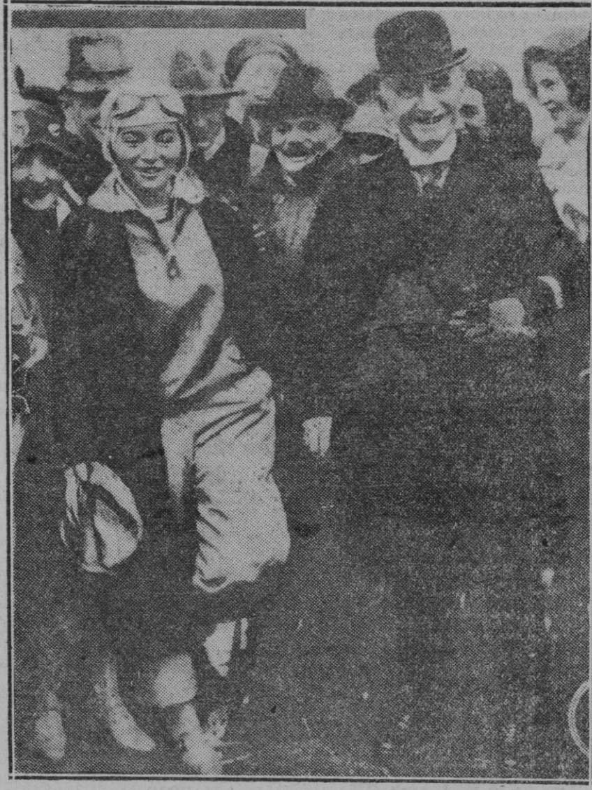
BERLIN.—La intrépida aviadora alemana, Elli Beinhom, después de su recorrido, lleno de peligros y aventuras por toda África Central ha regresado triunfante a Berlín donde ha sido recibida con gran entusiasmo. En la foto aparece la aviadora, en el momento de aterrizar con el ministro Reich doctor Guerdard otras personalidades que la acompañan

Por creerlo así y consecuentes con nuestra actitud, aplaudimos el interés mostrado por la Comisión Gestora Municipal, a la que no podemos dejar de alentar para que siga prestando atención a los problemas de la enseñanza, que forman el problema esencial para todo ideal de mejoración.