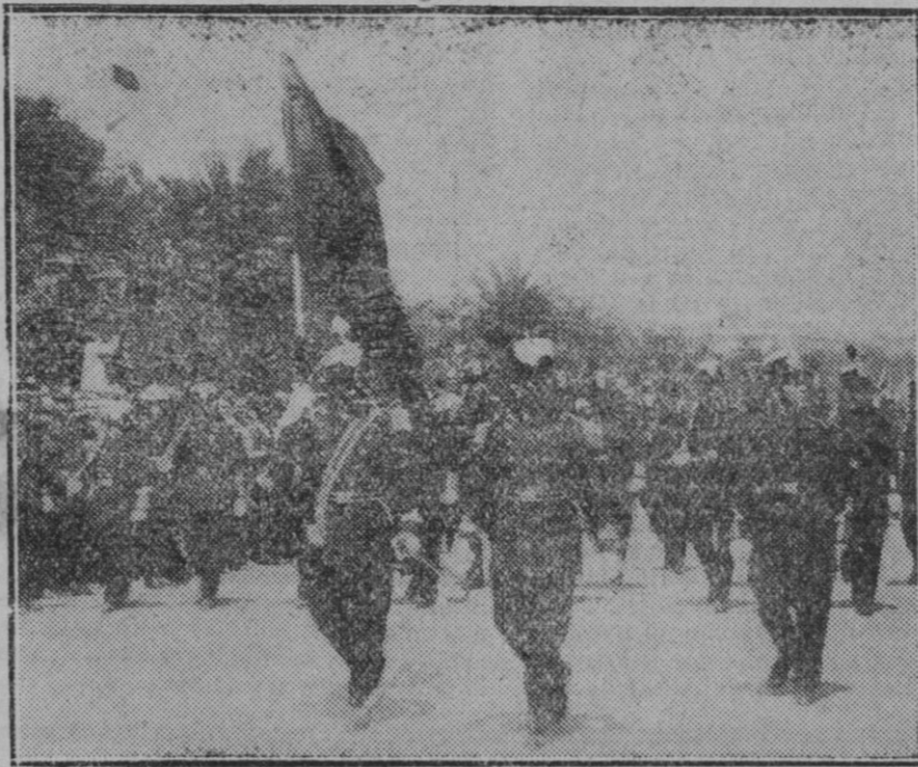
MADRID.—Los milicianos nacionales, desfilando esta mañana ante las autoridades con motivo de las fiestas del Dos de Mayo.

Y esta mayoría, en la estructuración de un estado liberal y democrático, tiene un imperio absoluto y éste ha de marcar en el nuevo Estado la relación entre Mallorca y España. En esta relación no cabe interponer otros nombres.