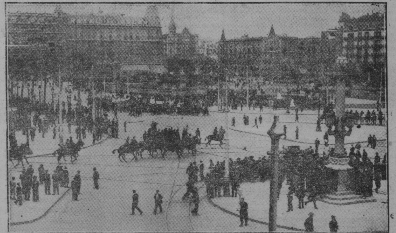
BARCELONA.—Las fuerzas públicas saliendo al paso de la manifestación comunista, en la plaza de Cataluña que se dirigió luego a la plaza de la República, en donde se desarrollaron los sucesos de estos días últimos

DE LOS ARTICULOS FIRMADOS RESPONDEN SUS AUTORES. LA PUBLICACION DE UN TRABAJO FIRMADO NO SUPONE LA CONFORMIDAD A LO QUE SUSTENTE. LA OPINION DEL DIARIO ES REFLEJADA POR SUS PROPIOS ARTICULOS.