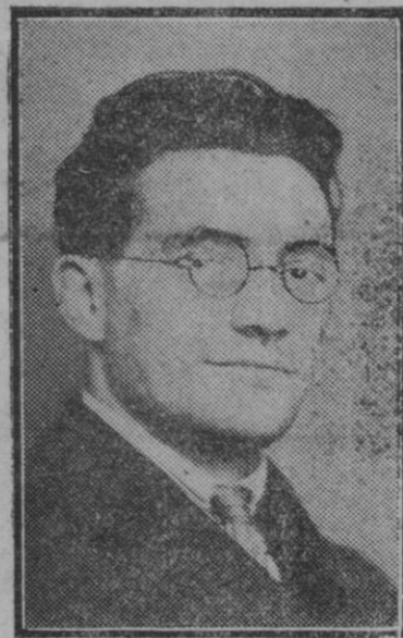
El famoso diputado comunista francés Doriot, que, según un telegrama de París, atravesó ya la frontera española y viene a nuestro país, delegado por las autoridades de Moscú, con objeto de hacer propaganda bolchevista.

A. I. Abril de 1931. Agencia Internacional Arco. (Reproducción prohibida).