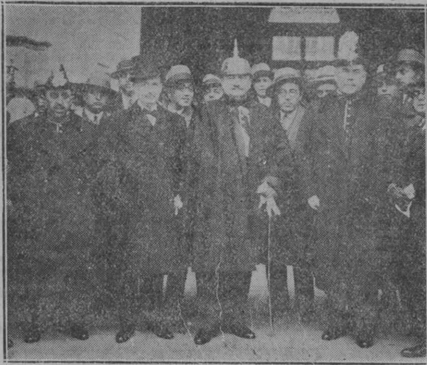
MADRID.—El General Berenguer y los ministros que juraron hoy en Palacio, después de la ceremonia rodeados por periodistas

Pero un mínimo de previsión nos fuerza a mirar con optimismo nuestro porvenir, y a esperar que el tráfico industrial y el de pasaje vayan en aumento, y en esta creencia, que lógicamente la hemos de tener, hemos de aspirar como hemos dicho al principio de estas líneas, a que nuestra ciudad sea dotada de un puerto amplio, cómodo, moderno, donde sea posible contener el tráfico y en el cual puedan establecerse todas aquellas industrias relacionadas o derivadas de las del mar.