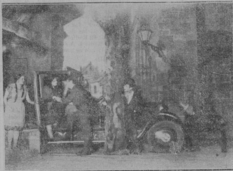
MADRID.—Una escena de "El Séptimo Cielo", en el teatro Reina Victoria

Nosotros, atentos a la conveniencia de nuestra región, hemos de proseguir, con la máxima intensidad posible, la campaña que hace tantos años sostenemos hasta conseguir que Mallorca cuente con carreteras apropiadas para que el turismo pueda recorrerla cómodamente.