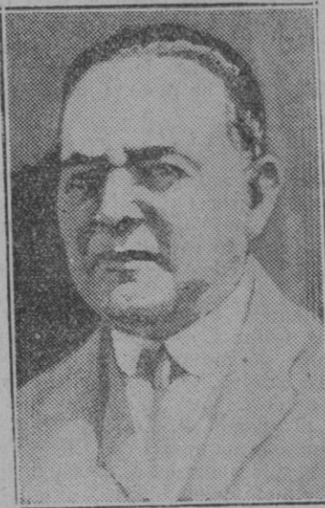
EXTRANJERO.—El Presidente de la República Argentina que ha dimitido su cargo, D. Hipólito Yrigoyen