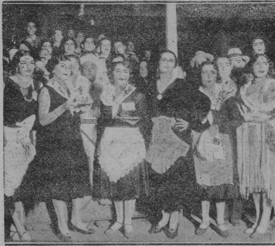
MADRID. — La verbena organizada por el Sindicato de actores en el Parque de Recreo del Retiro. En la foto se ven algunas de las artistas que estuvieron en los puestos sirviendo refrescos y vinos.

Obra tan en extremo conveniente no puede pasar por alto al Ayuntamiento, al formar éste el plan de mejoras a realizar.