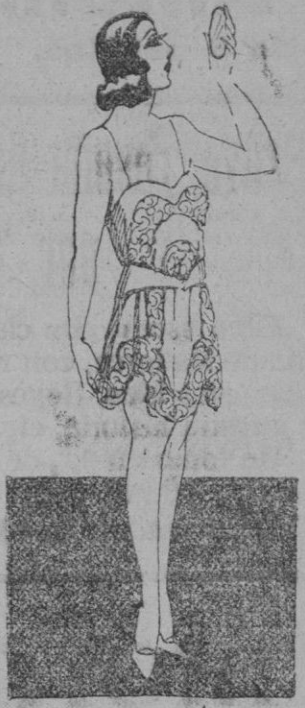
CAMISA.—Atrayente camisa en petite soie y encajes de Alençon

La pintura, desde la Edad Media, hasta la época contemporánea, no es sino una larga y admirable glorificación de la madre. Van Dyck, Rafael, Miguel Angel, Corregio, Ticiano, Mu-