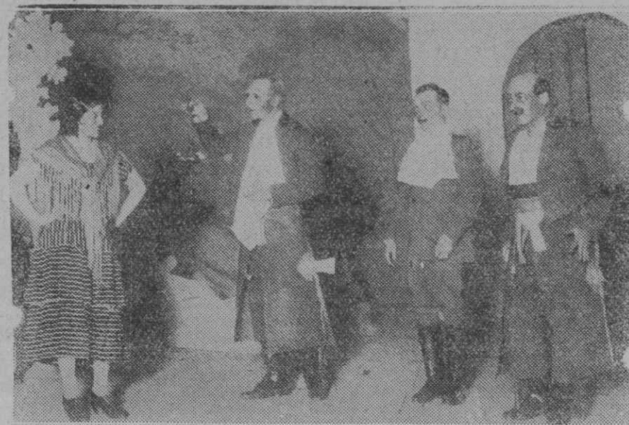
TEATRO CALDERON.—Una escena de la zarzuela "María la Tempranica."

Ambas peticiones han sido atendidas y de ello hemos de congratularnos muy cumplidamente, ya que de ambos servicios Mallorca habrá de verse grandemente beneficiada.