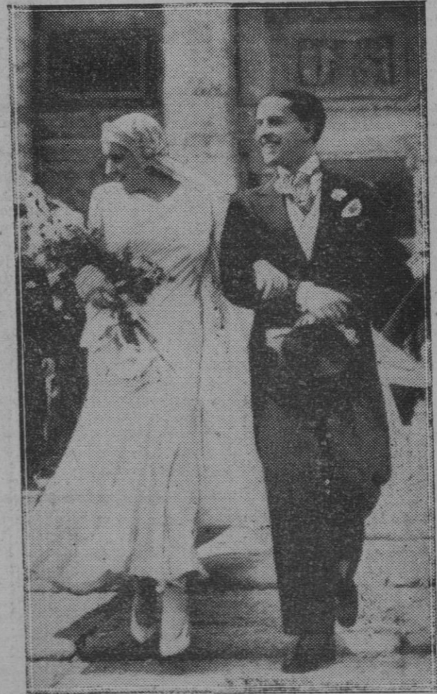
ITALIA.—Edda Mussolini y su esposo, el conde Gebazzo Ciano, saliendo de la Basílica de San Pedro, en Roma, después del enlace matrimonial que se efectuó hace pocos días