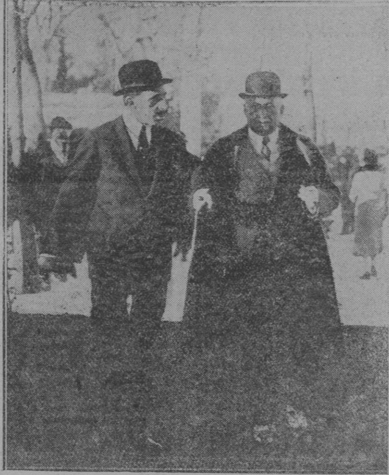
Una interesante fotografía de Su Majestad el Rey y el general Primo de Rivera paseando por el Hipódromo

No es justo que en tanto los industriales y comerciantes de Palma y de algunos pueblos, se ven sometidos a la jornada de ocho horas y privados, salvo casos excepcionales previstos en la ley, de trabajar a horas extraordinarias, haya localidades donde con o sin mayores retribuciones se implanten caprichosas jornadas, con lo que pueden competir y vencer a los productores establecidos en aquéllas.