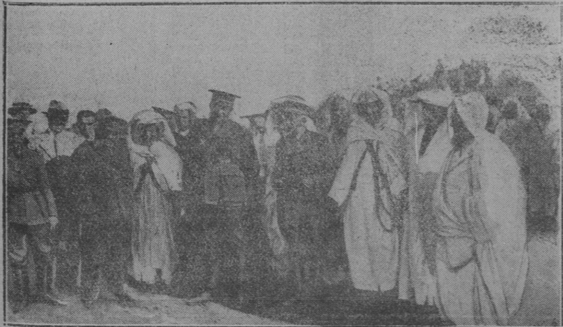
El Marqués de Estella con el general Sanjurjo, entonces Alto Comisario, y los moros notables, que le recibieron a su llegada a un campamento durante su último viaje a África.