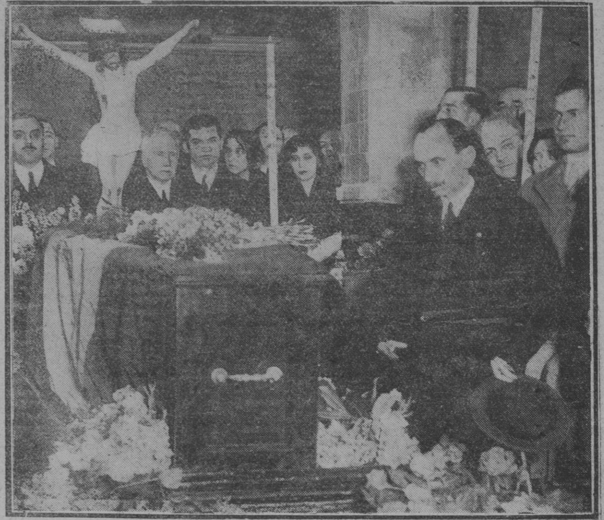
MADRID.—He aquí, el momento de ser depositado en la capilla ardiente de la estación del Norte el féretro con el cadáver del Marqués de Estella