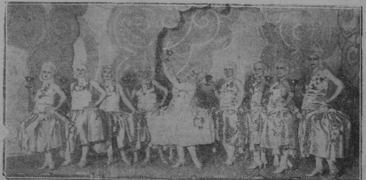
MADRID.—Una escena de la revista "Ali-Melá," estrenada con gran éxito en el teatro Pavón

—No hay nada que pueda calmar esa tos. La nube de cloro y bromo se abatíó sobre las trincheras de pri-