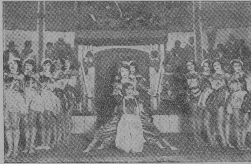
MADRID.—Un sugestivo momento de la revista "El Gallo," estrenada en el teatro Madrid

que al contarlos con los dedos de una mano sobrarían el índice y el apular, cuando menos. En el primer sitio de Tebas las víctimas fueron muy reducidas en número, y todas ellas, a Dios gracias, disfrutaron de buena salud. En la ciudad, los únicos lugares de desolación se denominan el Gran Casino y el Kursal, ante cuyos muros siguen derramando infinitas lágrimas quienes se nutrían de las urbes gigantes de "la vaca crepuscular".