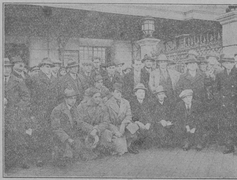
BARCELONA.—Interesante grupo formado por el equipo Checo-eslova que acaba de llegar a esta capital.