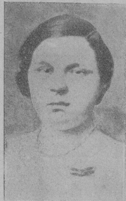
La Princesa Juliana heredera del trono de Holanda, cuyo matrimonio con el Príncipe Guillermo Esbach Schocheng se renuncia

Pero nuestro buen campesino no quiso dejar de cumplir la ley. Y espe-