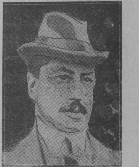
Hilferding, ministro de Hacienda del Gobierno de Reich, autor del programa financiero, cuya votación favorable en el Reichstag afianzó en el Poder al Gobierno que preside el canceller Müller.