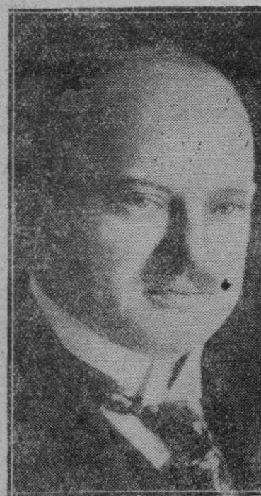
Dr. Stresemann, Ministro de Negocios Extranjeros de Alemania, que acaba de fallecer víctima de apoplejía.