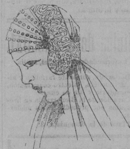
TOCADO PARA NOVIA.—Elegante y moderno tocado para novia de georgette de seda y brocado de plata y perlas