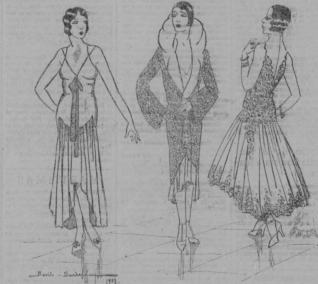
TOILETTES.—Sobrias y elegantes toilettes para noche.—El primero es un elegante modelo interpretado en georgette de seda lila, con lazo en el pecho de terciopelo chifón.—El segundo es un abrigo de insu- perable elegancia ideado en rico terciopelo y cuello de zorro gris.—El tercero es muy novedoso y atrayente confeccionado, la falda en gasa chifón azul, el corsage y bajos de la falda en brocado de plata.

Se tiene en remojo durante una noche entera en una maceta de bar- ro, bien limpia, y un trozo de fran- ella ídem. Después se coloca la man- teca sobre un plato, se pone encima, dada vuelta, la maceta húmeda, y se recubre ésta con el trozo de franela que se seguirá mojando ligeramente cada día.