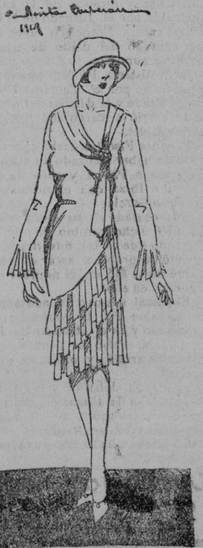
VESTIDO.—Encantador vestido para tarde de crepé georgette gris perla, un gran broche de pedrería en el cue- llo es el único adorno.

Se limpian con agua fresca, y con la punta de un cuchillo se les sacan los huesos sin maltratarlos, habiendo cortado antes un pedazo redondo de la flor, para volver a tapar después el agujero que se habrá hecho al sacar los huesos, teniendo ya preparada la cantidad necesaria del picado igual al que se ha dicho para las cebollas, y llenando la cavidad resultante de la extracción del hueso y tapado éste con el pedacito del mismo melocotón, se cocuen con el caldo prevenido, y coci- dos, se les echa una salsa de avellanas tostadas, yemas de huevos duros, es- pecias, azúcar y un poco de zumo de