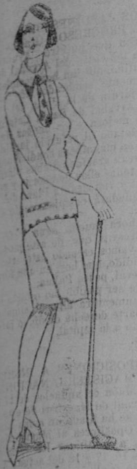
Lindo traje para sport—de lana fina amarillo pálido y de seda del mismo color con botones azules, debajo del jersey pue- de verse una ligera blusa del mis- mo color con una gran corba- ta con lunares azules.