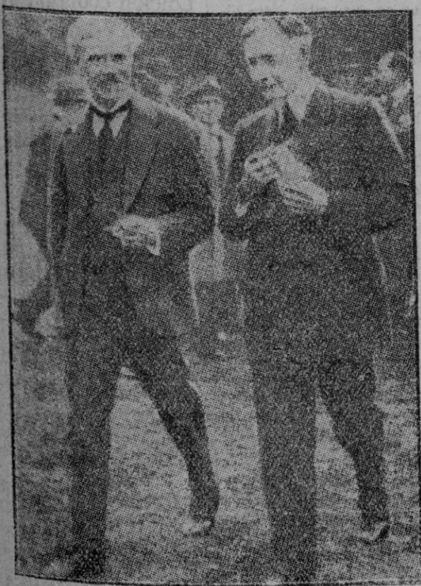
Magdonald y el general Dawes saliendo de la residencia del primero en Forres, después de celebrar su primera entrevista, en la que trataron del desarme naval.