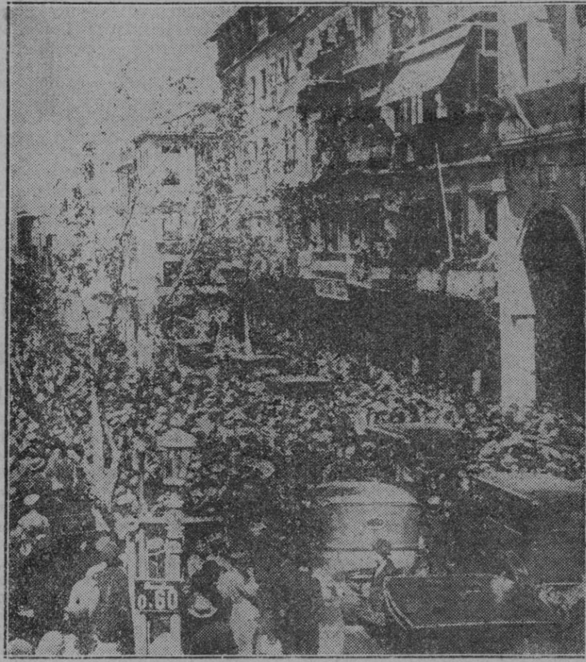
TOLEDO.—Aspecto que ofreció la plaza del Zocodover al despedir al general Primo de Rivera, que asistió a la Asamblea del Secretariado Nacional Agrario.

Entre las cosas curiosas que ha confesado este hombre que pasa por ser el hombre más rico del mundo,