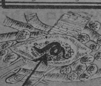
Triquina en un salchichón de cerdo

croscopio y cuya existencia fue negada durante largo tiempo hasta por grandes investigadores? Primeramente se las considero como animales; al parecer, porque muchas especies se mueven muy enérgicamente. Luego se opinó que eran plantas, de estructura algo semejante con los virus, todavía más pequeños, como una clase especial de seres vivos, completamente diferente del mundo animal y vegetal, por-