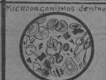
MICROORGANISMOS dentro una gota de agua