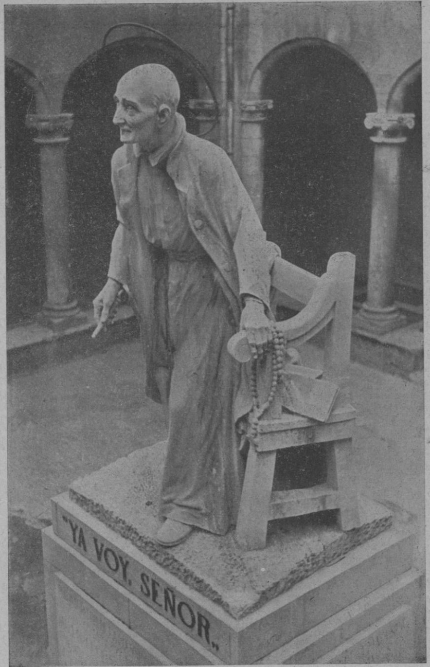
"SAN ALONSO RODRIGUEZ" Co-Patrono de Palma

Añadió que sus Memorias son una prueba convincente de su adhesión a la política de paciencia y de su odio a la guerra. «Podéis imaginaros mi sorpresa — dijo — cuando vi en los periódicos de Washington grandes titulares diciendo que yo hacía exhortaciones para que fabricáramos bombas atómicas más grandes y que se utilizara la fuerza para expulsar a los rusos de Alemania».