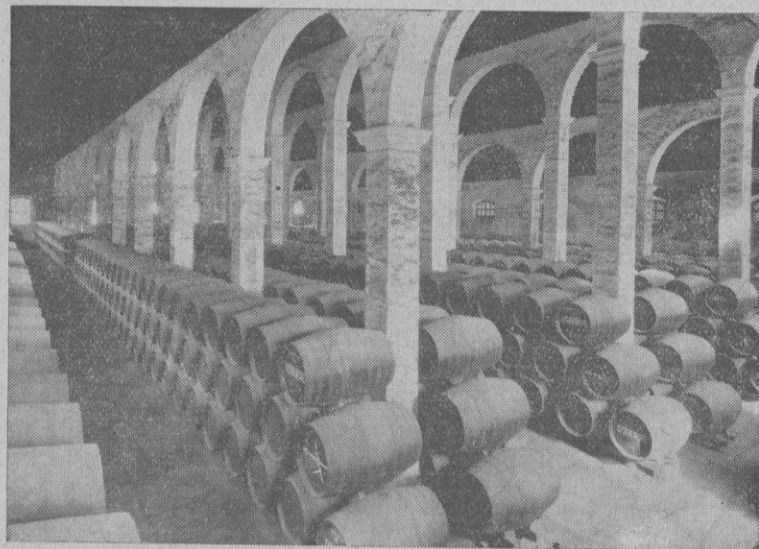
Bodega de SAN JOSÉ. «Bodega monumental» albergando en su recinto 25.000 botas de 500 litros cada una, de exquisitas y renombradas SOLERAS.

Alcemos esta copa que llena con su vida la sangre de las viñas de España. Labebida será de nuestro impulso magnífico crisol. El vino de la Patria, la esencia bendecida de cuanto es ansia y sueño brillante y español.