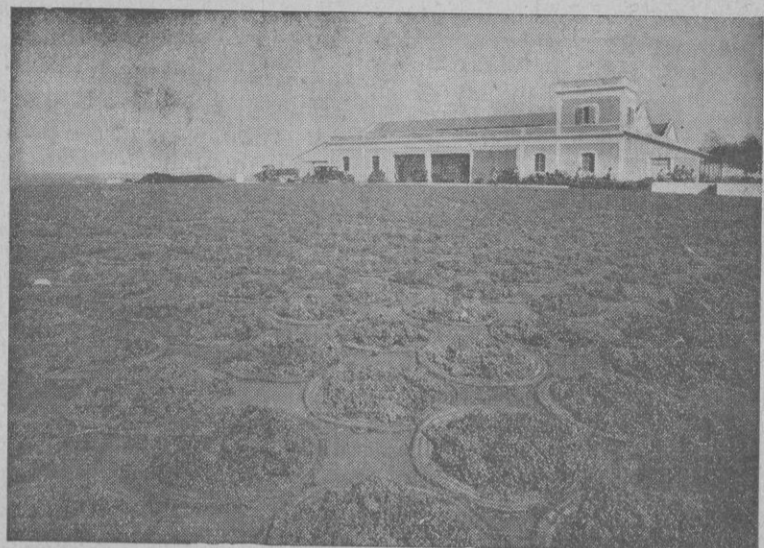
VIÑA "LA ATALAYA" Soleado de la uva