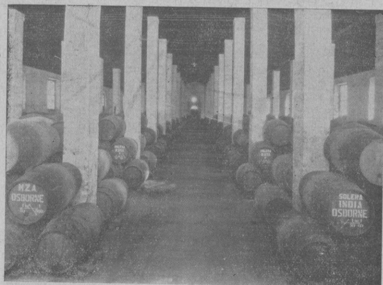
BODEGA DEL "COÑAC"

Osborne ha consagrado los nombres: Veterano , que encierra los prestigios del tiempo más lejano. Y Fino Quinta , claro, de místico sabor. Y el brandy de Tres Ceros , espléndido y galano. Y el puro Coquinero , de vinos el mejor.