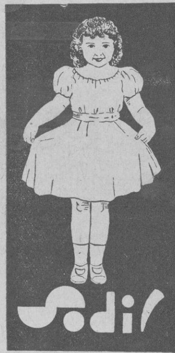
LAVA POR SI SOLO, ESPECIALMENTE SEDAS Y LANAS