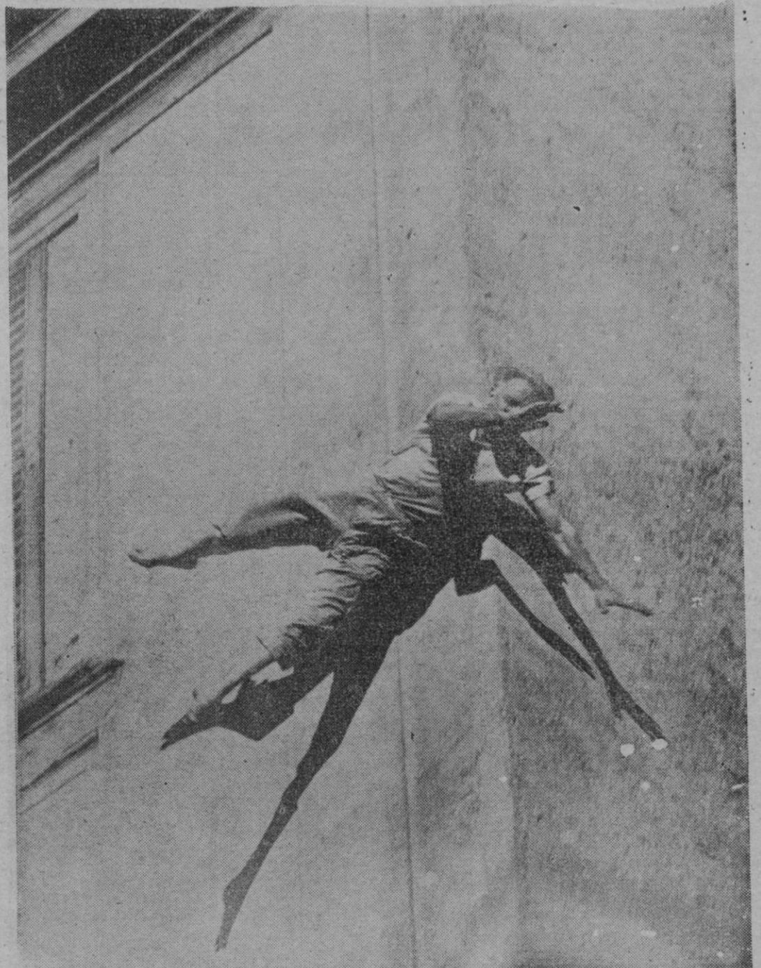
Un suicida da el salto trágico hacia la muerte.

• Por continentes, Europa se lleva la paima. Por países, Austria registra el mayor número de suicidios anuales, seguido de Checoslovaquia, Noruega y Suecia