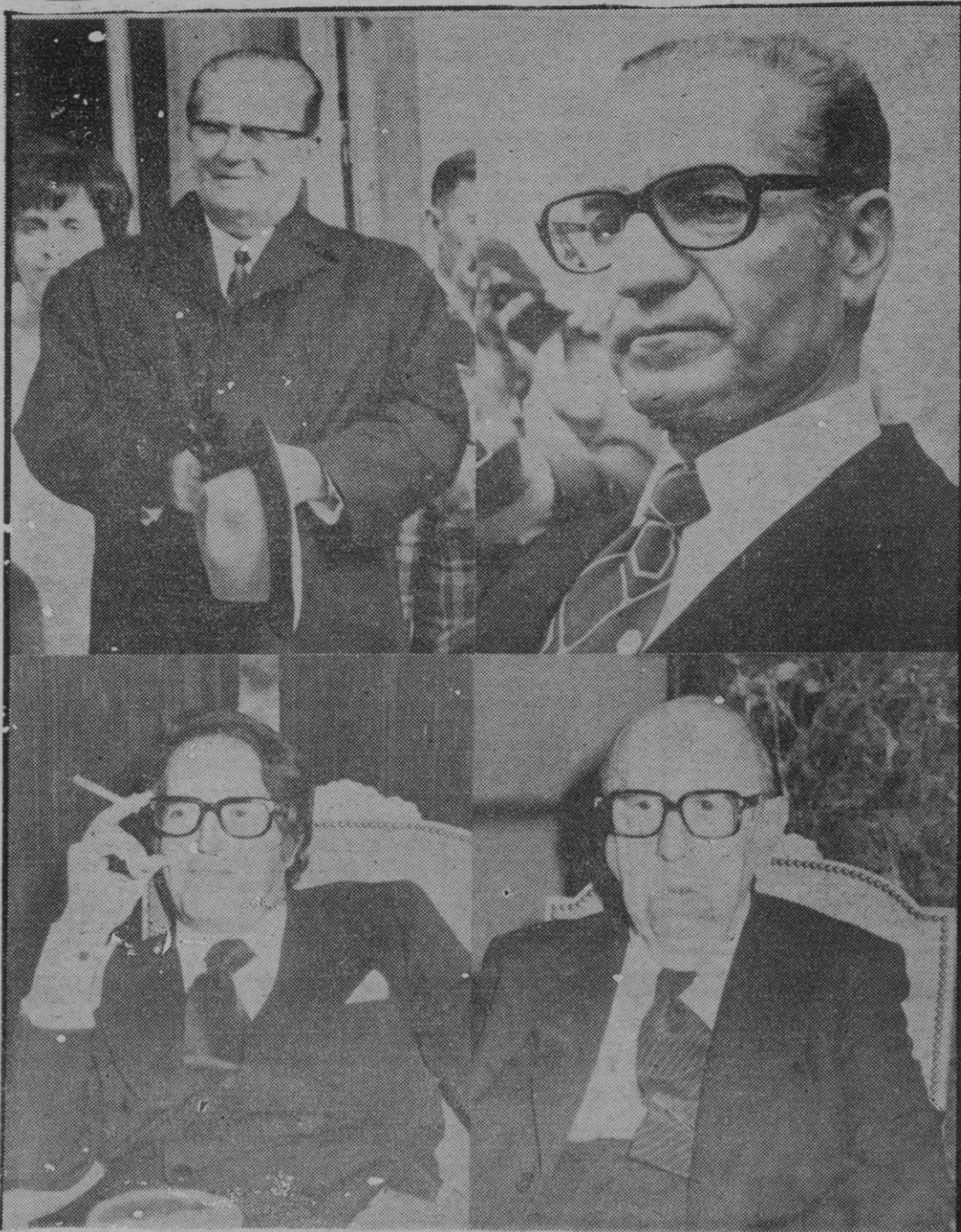
Cuatro de las personalidades políticas desaparecidas en 1980: Tito, el Sha Reza Pahlavi, Antonio Garrigues Walker y José María Gil Robles.