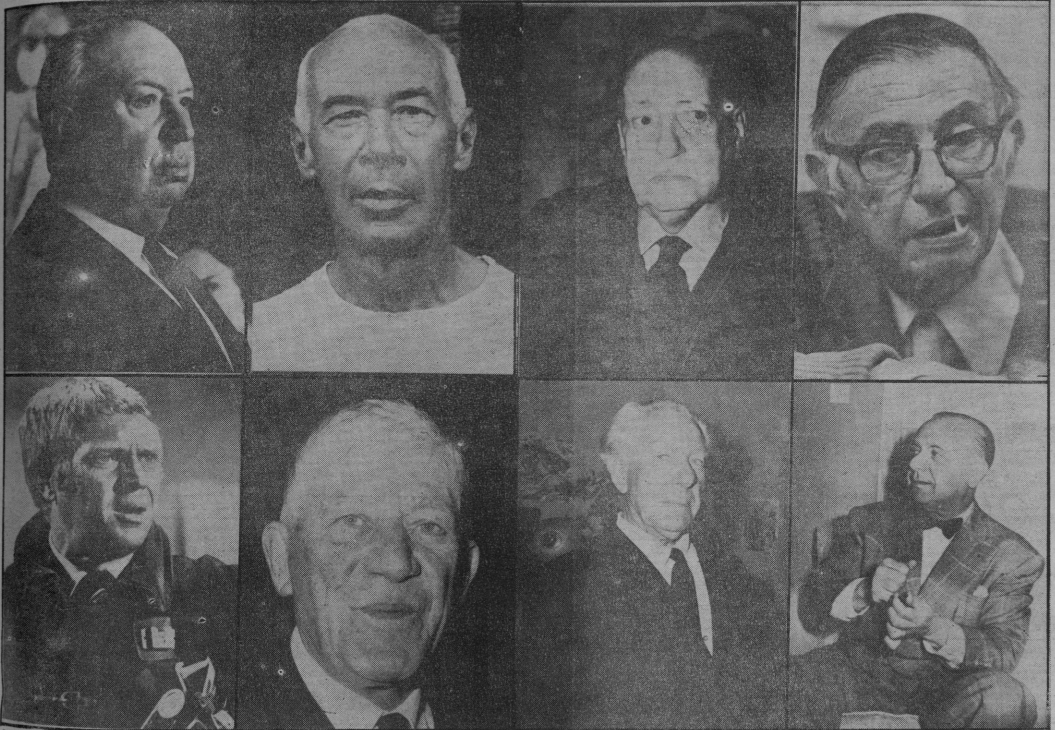
Personalidades del mundo literario y artístico desaparecidas durante 1980: (de izda. a dcha. y de arriba abajo) Alfred Hitchcock, Henry Miller, Alejo Carpentier, J.P. Sartre, Steve McQueen, Oscar Kokoschka, Benjamín Palencia y José Iturbi.

La avioneta cayó al suelo por causas desco-