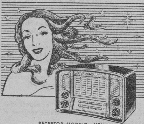
RECEPTOR MODELO "VENUS" Última adición a la famosa SERIE ESTELAR