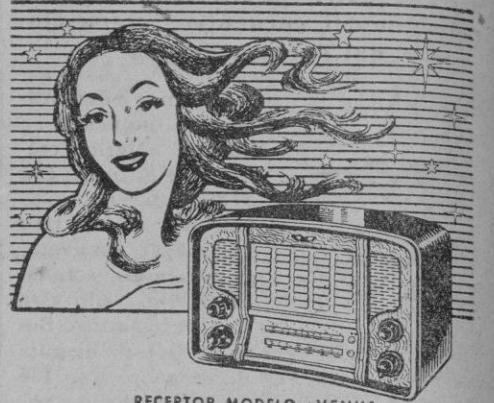
RECEPTOR MODELO «VENUS» última adición a la famosa SERIE ESTELAR