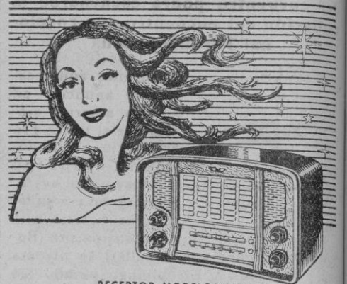
RECEPTOR MODELO «VENUS» Última adición a la famosa SERIE ESTELAR